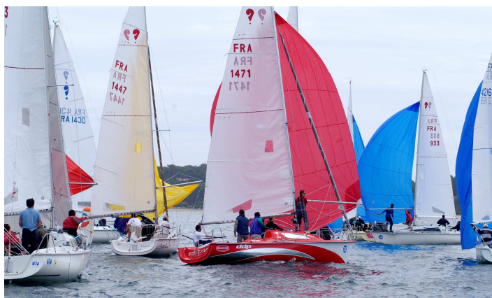
Joli Surprise rouge lors du précédent national à Arcachon

Juste retour des choses, le national de 2005 organisé dans ces mêmes eaux a laissé à nous tous un excellent souvenir. Ce sera donc avec beaucoup de plaisir que nous nous y retrouverons. Certes les eaux sont délicates, les courants pas faciles à négocier, les vents capricieux, mais les huitres sont délicieuses et le paysage magnifique. Le bassin, un écrin pour notre bijou de SURPRISE.