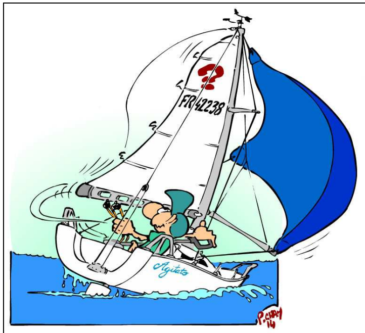
Bertrand dans ses œuvres

son coup, ne pas hésiter à repartir en arrière - avant la tenue de la fausse panne -, dans l'attente de conditions, de vague et de vitesse, propices)