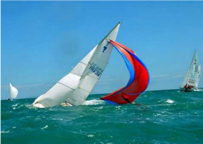
Un empannage raté pour Les FLAMANDS un maxi loof avant la punition de l'abattée en suivant.

Dans des conditions musclées, la grand-voile du Surprise étant de bonne surface, le transfert de sa force vélique d'un bord sur l'autre est la principale cause de déséquilibre. Les centres véliques et hydrodynamiques ne sont plus momentanément superposés.