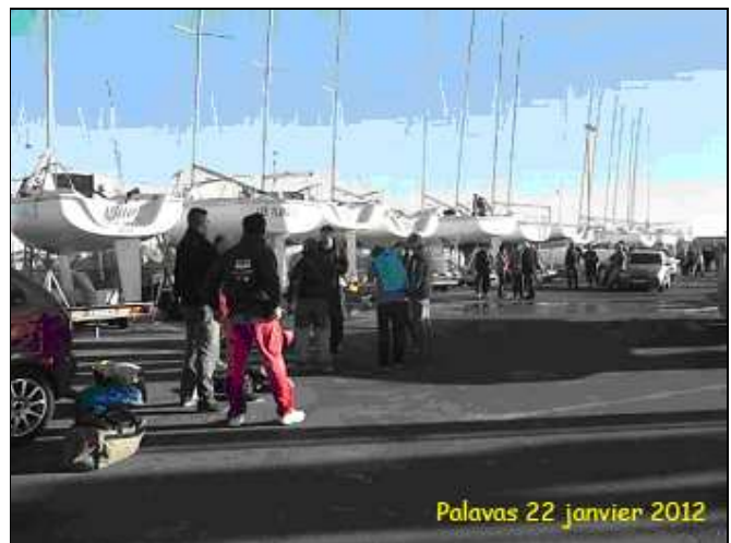
Palavas 22 janvier 2012