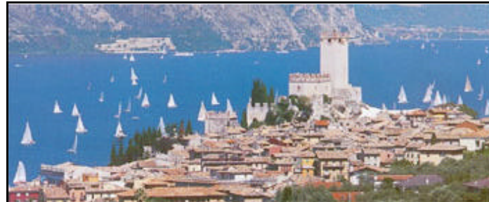
une vraie carte postale